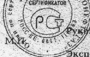
Схема сертификации - 3а

ДОПОЛНИТЕЛЬНАЯ ИНФОРМАЦИЯ Знак соответствия по ГОСТ Р 50460 наносится на изделие и в сопроводительной технической документации.