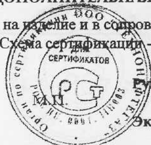
Схема сертификации - За

на изделие и в сопроводительной технической документации.